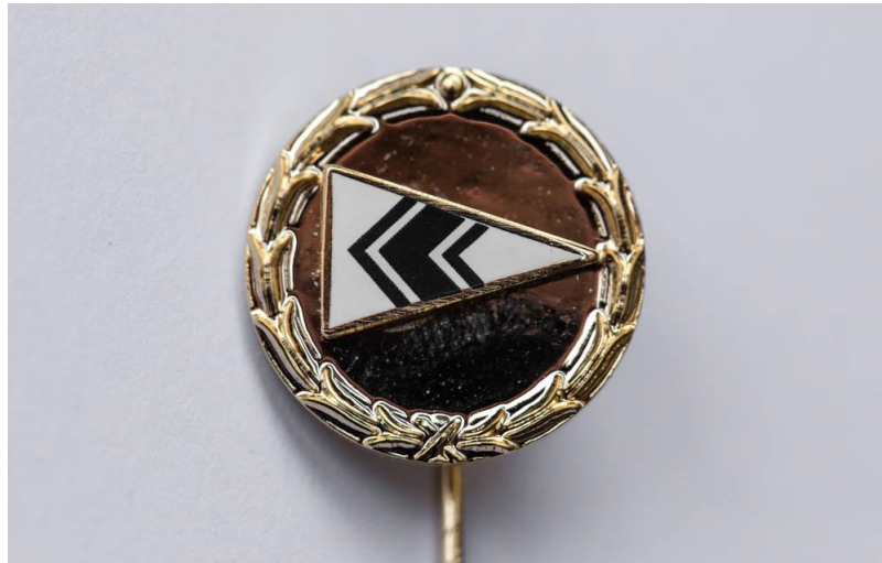
Abbildung 2: Ehrennadel für besondere Verdienste