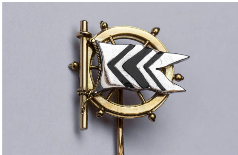
Abbildung 1: Commodore-Nadel

Die Ernennung zum Commodore ist die Verleihung eines Ehrentitels. Im Übrigen verbleibt es bei den gleichen Rechten und Pflichten eines Ordentlichen Mitgliedes.